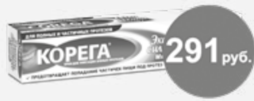
Корега крем 70г экстрасильный