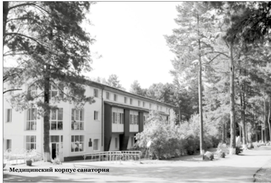
Медицинский корпус санатория

В санатории для детей действует программа «Лечебно-оздоровительная педагогика». Она направлена на общеукре-