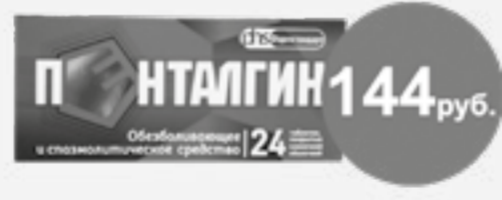
Пенталгин №24 таб.