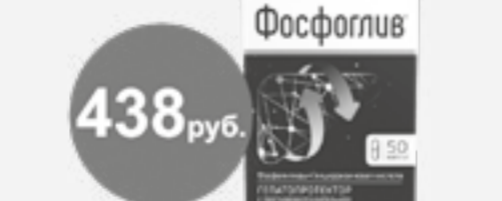
Фосфоглив №50 капс.