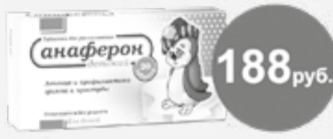
Анаферон детский №20 таб.

Цены указаны при покупке от двух упаковок одного наименования