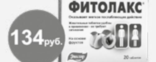
Фитолак №20 таб.